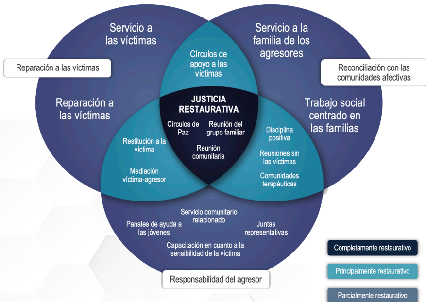
Gráfica 1. Tipos de resultado restaurativo