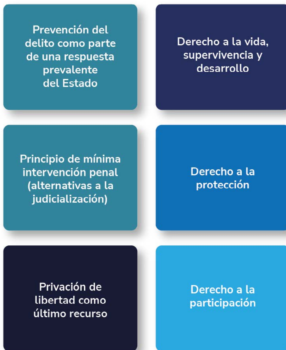
Figura 1 – Esquema de principales categorías de DDHH en el SRPA